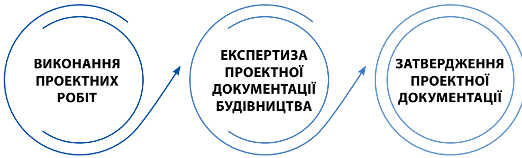
СХЕМА №1 БІЗНЕС-ПРОЦЕСИ НА РИНКУ

Ринок, який є предметом цього аналізу, стосується виконання робіт з архітектурного проектування і будівельного проектування та конструювання промислових та громадських будівель і споруд, у тому числі житлових.